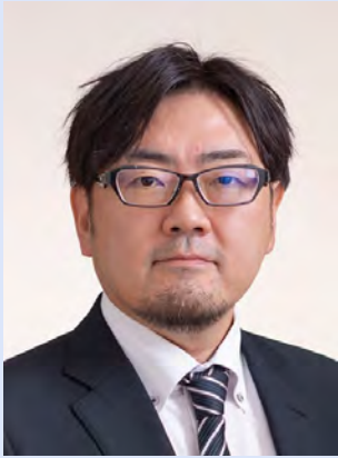
公益社団法人 八戸法人会青年部会