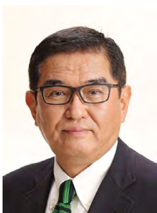
公益社団法人 八戸法人会

キャッシュレスやデジタルインボイスなど、税務を含めたDXの進展が加速度を増す中、税務行政の良き理解者としての皆様の存在も、ますます重要度を増しております。今後とも御理解と御協力をお願い申し上げますとともに、会員各位の御健勝並びに事業の御繁栄を心から祈念いたしまして、お祝いの言葉といたします。