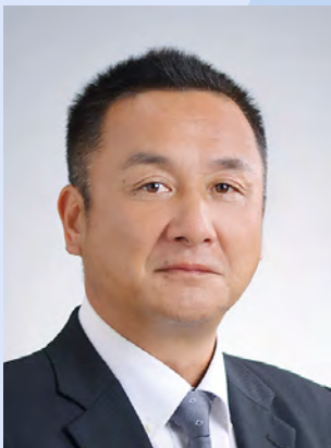
公益社団法人 八戸法人会青年部会 設立30周年記念事業

今後も、会員企業と地域の発展、そして次代を担う子供たちの未来のために、これまでの経験で培った力を存分に生かし、様々な事業を展開して参りますので、これからも一層のご指導とご鞭撻の程よろしくお願い申し上げます。